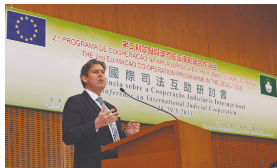
副国际法律专员（司法互助）华伟思资深大律师在澳门举行的国际司法互助研讨会上发言