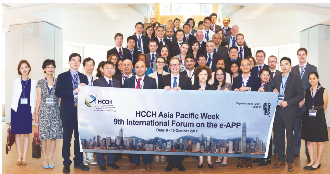
国际法律科与海牙国际私法会议亚太区域办事处合办的第九届海牙电子认证国际论坛的参加者

有关借海牙公约方便营商研讨会。研讨会取得良好成果，并在2014年11月发表的亚太经合组织部长联合声明及经济领导人宣言中获表明确认。