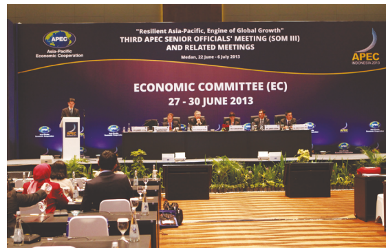
国际法律科的律师在印尼棉兰亚太经合组织第三次高级官员会议期间举行的经济委员会工作坊上发言

此外，区域办事处与国际法律科合作在亚太区推广采用各项海牙公约，以推动区内的法律合作。当中尤值一提的是，在亚太经济合作组织（亚太经合组织）经济委员会的支持下，区域办事处与国际法律科的律师协办亚太经合组织《海牙认证公约》工作坊，这项活动在2013年6月于印尼棉兰举行，目的是推广采用《海牙认证公约》，以增加公文的流通性。工作坊取得丰硕成果，亚太经合组织部长因而留意到《海牙认证公约》的重要性，并在2013年10月发表部长联合声明，鼓励成员更广泛参与《海牙认证公约》。