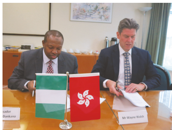
代表团团长草签协定