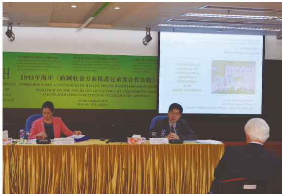
与海牙国际私法会议亚太区域办事处在澳门合办1993年海牙《跨国收养方面保护儿童及合作公约》工作坊

区域办事处成立后，国际法律科的律师继续作出多方面的支援，包括于2013年3月与区域办事处在澳门合办海牙《跨国收养公约》工作坊。