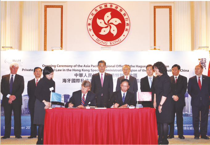
律政司司长袁国强资深大律师（前排右二）及前海牙会议秘书长汉斯·范鲁（前排左二）签署关于在香港特别行政区成立亚太区域办事处的行政安排备忘录

议于2012年12月13日在香港特区开设亚太区域办事处（区域办事处）。设立区域办事处之举，标志着海牙会议对香港特区作为区域法律服务中心投下信心一票。