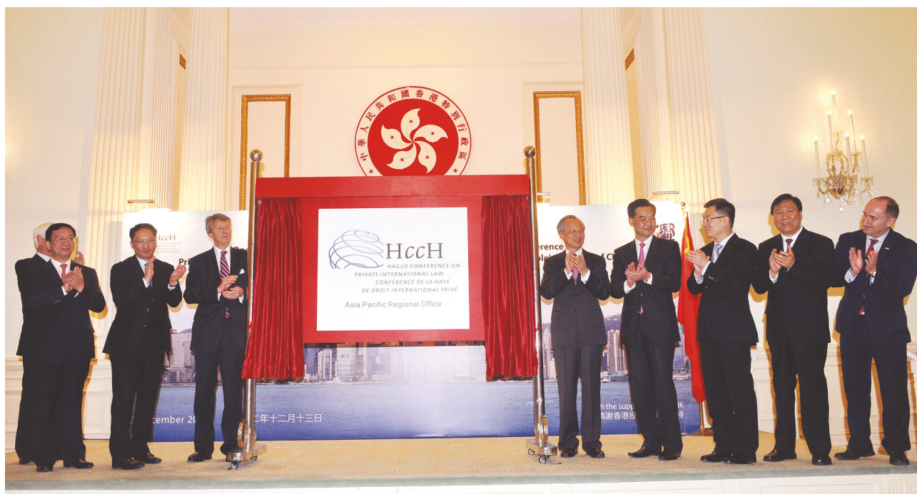
海牙国际私法会议亚太区域办事处开幕典礼